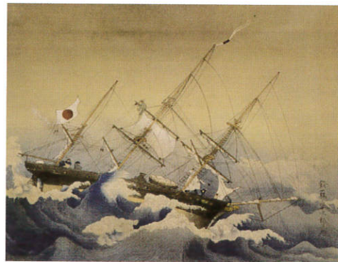
咸臨丸難航図(木村家蔵・横浜開港資料館保管)

1860年、日米修好通商条約の批准書交換のため、幕府使節団が太平洋を渡った時、咸臨丸には日章旗がはためき、使節団を歓迎するため、ニューヨークのブロードウェイには日章旗と星条旗が掲げられた。